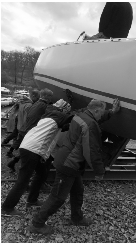
Det här är klubbanda.

Ett förslag till medlemskategorier, där en del (familjemedlemmar, delägare i en yacht, seniorer med flera) får en reducerad avgift blev ifrågasatt. Kategorier kan ju antingen tolkas som en värdering av medlemmar eller som ett sätt att tillmötesgå önskemål på lägre avgifter för en del medlemmar. Den avslutande omröstningen visade att de flesta stödde förslaget, 14 medlemmar var för och 8 mot,