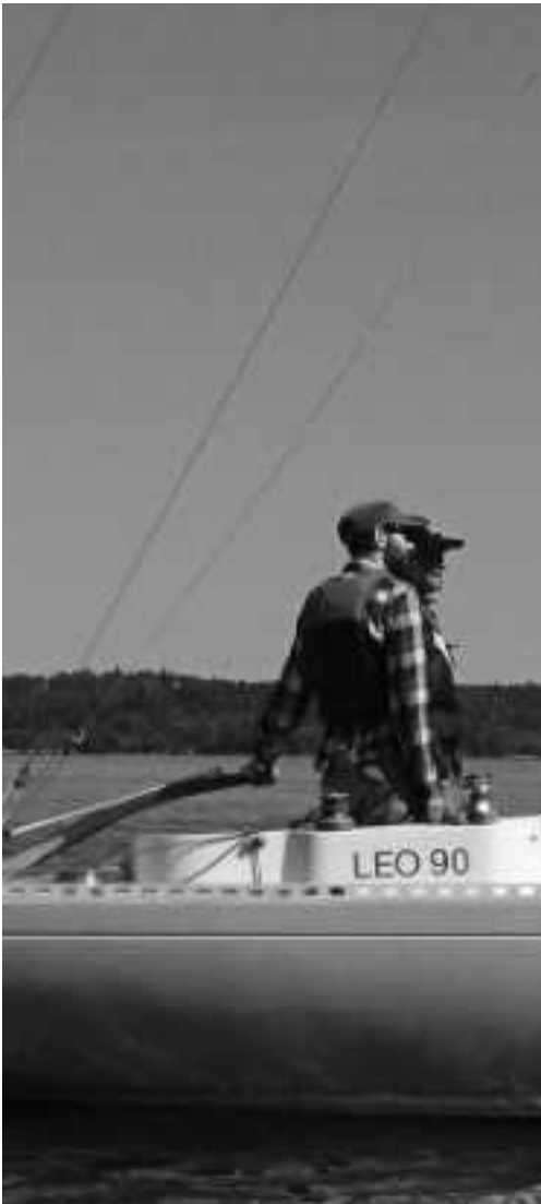
På spaning efter lite eller mycket vind...

Det tycks vara helt hopplöst att få till ett allt i genom perfekt Boo fyr.