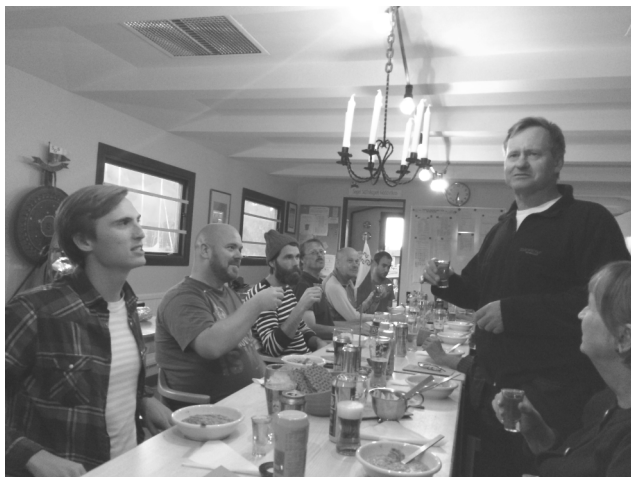
Eriks sista Gäddisskål?