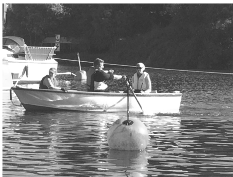
Vi tar det med ro fast vi tävlar...