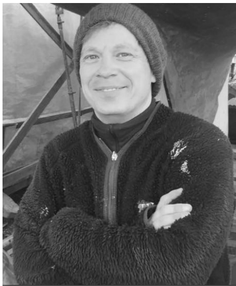
Aldrig med armarna i kors?

- Andra gången seglade jag med en kompis Albin Vega i Södertälje, det